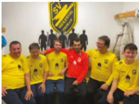
Unser Bild zeigt die stolzen Fußballer des Inklusionsteams des SV Weilertal mit den neuen Trikots

Kontakt Daten SV Weilertal Inklusion V.Kaiser-Willeken, 01520-9534113 Hör Huus: www.myhoerhuus.de