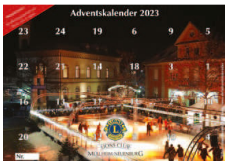
Dieses Jahr zielt der Markgräfler Platz mit der Eisbahn in Müllheim die Titelseite des Adventskalenders.

Der Verkaufspreis beträgt wie im vergangenen Jahr 5 Euro pro Kalender.