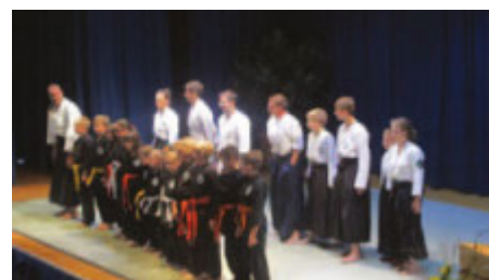
Aikido, Kickboxen und Jiu-Jitsu in der Tammazla Kampfkunstschule Müllheim

Weitere Informationen, auch zu den Trainingszeiten, auf www.tammazla.de .