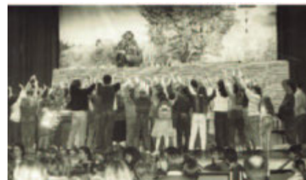
SPUNDI erscheint den Kindern des Markgräflerlandes